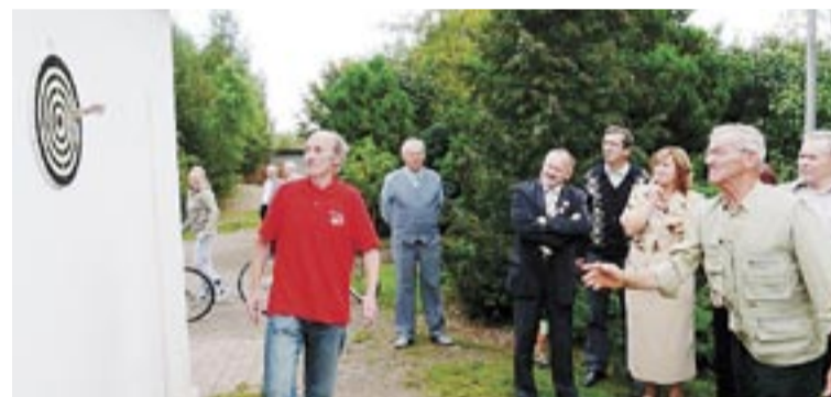
Emocje wzbudziły rzuty do celu.

różnorodnych imprez były w minionym okresie nasze działki, wspomnę więc tylko o ostatnich wydarzeniach. Działalność użytkowników działek została niedawno szczególnie doceniona. Zostaliśmy laureatem konkursu „Najaktywniejszy Ogród Działkowy Okręgu Sudeckiego w roku 2009”, otrzymując pamiątkowy dyplom i puchar. Na zakończenie I Kongresu Polskiego Związku Działkowców zarządy okręgowe otrzymały drzewka upamiętniające to wydarzenie. Nasz okręg otrzymał robinie akacjową, która została posadzona przed Domem Działkowca. Firma Gees przeprowadziła bezpłatne badanie słuchu. Utrzymujemy ścisły kontakt ze Stowarzyszeniem Rekreacyjno – Sportowym Dęby Wałbrzych, współorga-