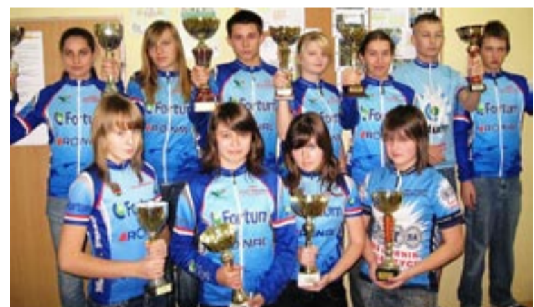
Niektórzy z wyróżnionych kolarzy.