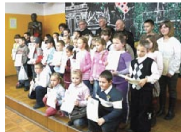
Wspólne nagrodzonych autorów z wałbrzyjskimi gwarkami.

Prace na okolicznościowej wystawie, wykonane różnymi technikami, także przestrzenne, ilustrowały wyobrażenia dzieci dotyczące pracy