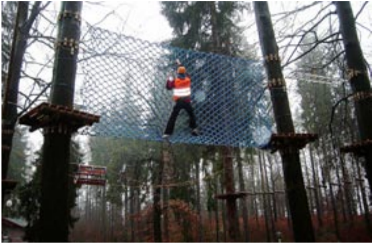
Park linowy w Jedlinie Zdroju może dostarczyć prawdziwej adrenaliny.