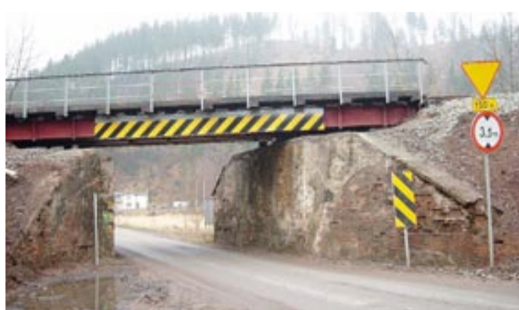
Po remoncie wiadukt w Sokołowsku przynajmniej będzie wzmocniony.

- Musimy dojechać małymi busami za wiadukt i dopiero tam przesiadać się do autobusu. To zabiera nam