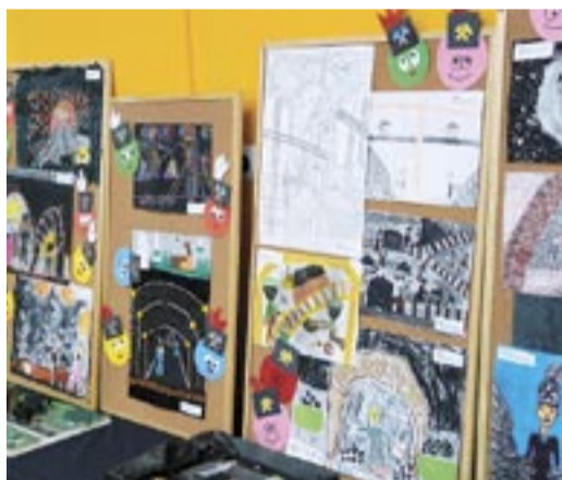
Część nagrodzonych prac.