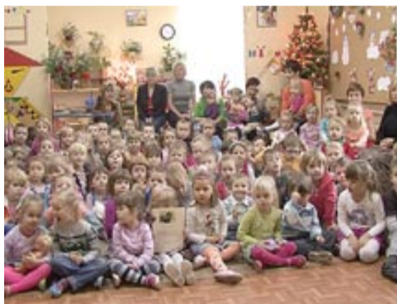
Przedsiębiorcy z „Tęczy” zrobili prezent zwierzętom ze schroniska.

W zbiorce żywności bardzo pomagają rodzice, którzy - przyprawiając bądź też odbierając swoje