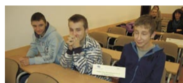
PG nr 4 w Wałbrzychu