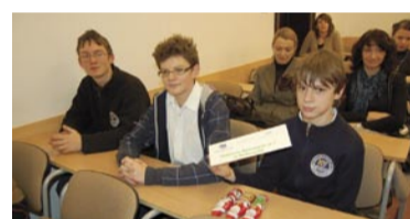
PG nr 7 w Wałbrzychu