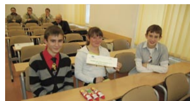
PG nr 3 w Wałbrzychu