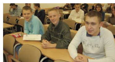
PG nr 14 w Wałbrzychu