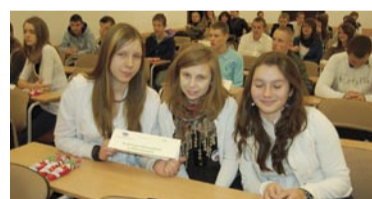
PG w Mieroszowie