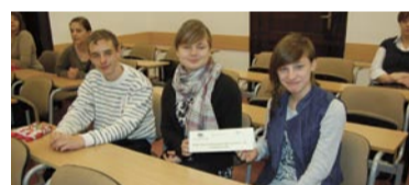
PG nr 11 w Wałbrzychu