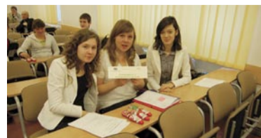
PG nr 1 w Boguszowie Górcach