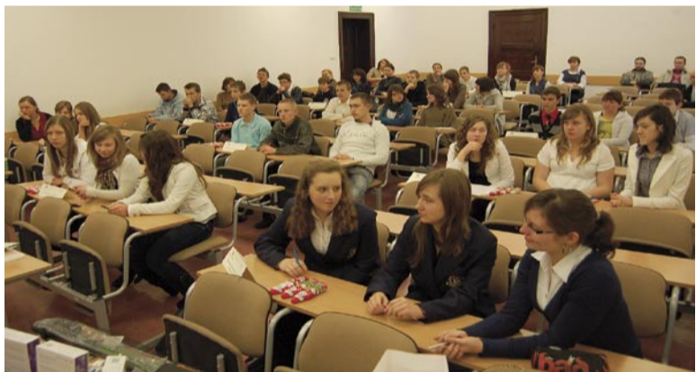
12 zespołów gimnazjalistów tuż przed rozdaniem testów