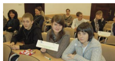
PG nr 6 w Wałbrzychu