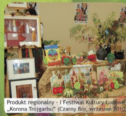
Produkt regionalny - I Festiwal Kultury Ludowej „Korona Trójgarbu” (Czarny Bór, wrzesień 2010)