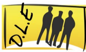
Dolnośląskie Liceum E-learningowe

Od grudnia 2010 rusza nowy projekt Fundacji Edukacji Europejskiej, tym razem skierowany do osób, które chcą uzyskać średnie wykształcenie i przystąpić do matury w 2011r. Jest to bardzo ciekawa forma edukacji zwłaszcza dla osób, które już dawno skończyły szkołę podstawową, gimnazjum czy też szkołę zawodową i boją się ponownie zacząć się uczyć.