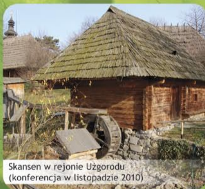
Skansen w rejonie Użgorodu (konferencja w listopadzie 2010)