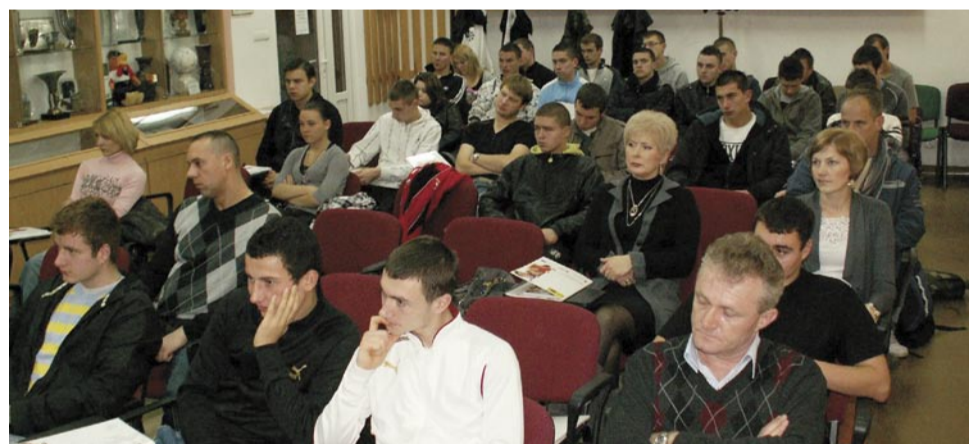
Konferencja wdrożeniowa w Zespole Szkół nr 5 w Wałbrzychu (16.XI.2010)

godzinach dostosowanych do własnych potrzeb można uczyć się i zdobyć średnie wykształcenie. Od grudnia 2010 na stronie internetowej www.dle.edu.pl uruchomiona zostanie platforma internetowa, na której wszystkie zainteresowane osoby mogą bezpłatnie przygotować się do egzaminów z 11 przedmiotów w zakresie szkoły średniej. Lekcje prowadzone będą w formie on-line tj. za pomocą atrakcyjnych prezentacji, udostępnianych przez Internet. Nad każdym przedmiotem czuwa nauczyciel, z którym będzie można konsultować się za pomocą czatu lub poczty