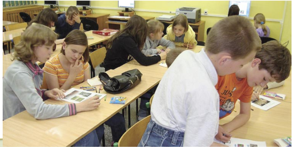
Warsztaty dla dzieci

projektu, w styczniu 2011r zaprezentujemy dokładne jego podsumowanie i opiszemy wszystkie działania