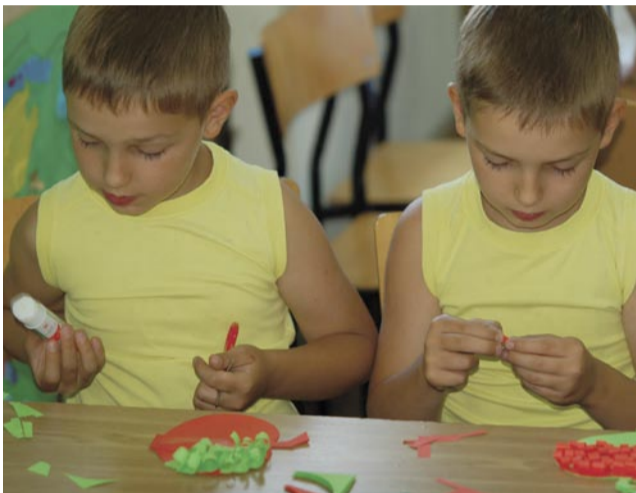
Młodzi Ekolodzy podczas letnich warsztatów