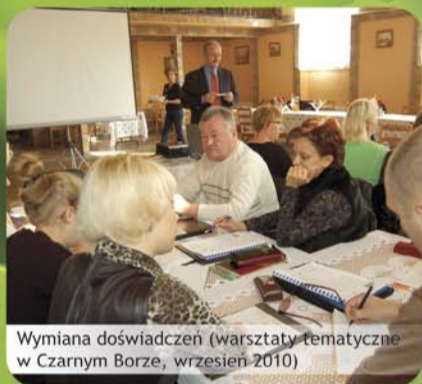
Wymiana doświadczeń (warsztaty tematyczne w Czarnym Borze, wrzesień 2010)