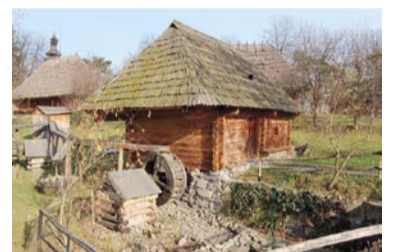
Skansen w rejonie Uźgorodu

W programie konferencji oprócz oficjalnych spotkań i prezentacji odbył się występ żeńskiego chó-