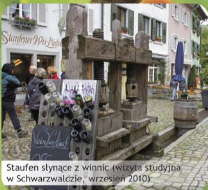
Staufen słynące z winnic (wizyta studyjna w Schwarzwaldzie, wrzesień 2010)