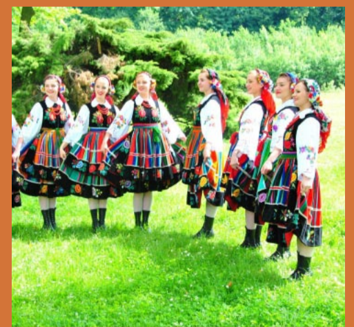
Gwiazdą będzie Zespół Pieśni i Tańca „Wałbrzych”, który w tym roku obchodził 55 urodziny.