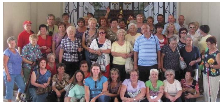
Seniorzy w Czechach

pieśni i piosenek ludowych. Dodatkowo organizowane są również trasy wycieczki. 31 lipca seniorzy z Czarnego Bory wyjechali do zabytkowej Pragi. A wszystko to w ramach projektu „Seniorzy spod Trójgarbu”, realizowanego przez Centrum Kultury w Czarnym Borze, we współpracy z Fundacją Edukacji Europejskiej. Jak ktoś jeszcze nie zdążył skorzystać z oferty „Uniwersytetu”, może jeszcze zadzwonić lub napisać do Centrum Kultury: 74/8450419, ck@ck-czarnybor.pl