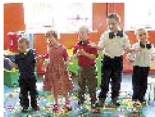
Dzień Mamy w Jaczkowie

Od stycznia 2010 Centrum Kultury w Czarnym Borze wspólnie z Fundacją Edukacji Europejskiej zorganizowało 3 placówki przedszkolne w miejscowościach: Grzędy Jaczków i Witków Śl. Punkty Przedszkolne działają w Gminnych Ośrodkach Kultury. Każda placówka oprócz obowiązkowej edukacji w zakresie przedszkolnej podstawy programowej, oferuje dodatkowe wsparcie dla rodziców i ich dzieci poprzez opiekę oligofrenopedagoga, logopedy i psychologa. Dzieci uczą się również rytmiki i tańca. W trakcie każdego roku szkolnego zaplanowane są wycieczki turystyczne np. w lipcu br dzieci odwiedziły Ogród