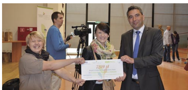
Radość przedstawicieli Instytutu Badania Kompetencji w Wałbrzychu.

Trzecia edycja Funduszu Toyoty - „Dobre pomysły zmieniają nasz świat” to 6 nowych projektów, które otrzymały dofinansowanie o łącznej wartości prawie 45.000 zł. W Państwowej Wyższej Szkole Zawodowej im. Angelusa Silesiusa w Wałbrzychu odbyła się uroczystość ogłoszenia wyników III edycji konkursu grantowego. W trakcie spotkania reprezentanci zwyciężskich projektów z Wałbrzycha, Jedliny Zdroju i Boguszowa Gorc przedstawili swoje pomysły. Wspierali ich studenci Architektury Krajobrazu PWSZ, którzy przygotowali koncepcje zagospodarowania przestrzennego.