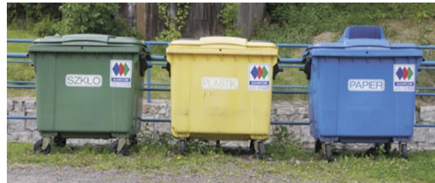
W gminie przybędzie pojemników do segregacji odpadów.