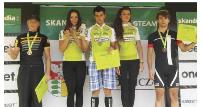
Podium maratonu w Dąbrowie Górniczej.