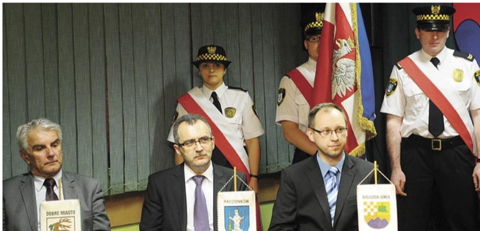
Uroczysta sesja Rady Miejskiej Radzionkowa z udziałem przedstawicieli Boguszowa Gorce i Dobrego Miasta.

7 czerwca 2013 r. Boguszów-Gorce, Dobre Miasto i Radzionków obchodziły X-lecie współpracy partnerskiej. Z tej okazji w Radzionkowie, mieście w którym podpisane zostało trójstronne porozumienie dotyczące partnerskiej współpracy pomiędzy gminami, odbyła się uroczysta sesja rady miejskiej, w której uczestniczyli przedstawiciele wszystkich miast.